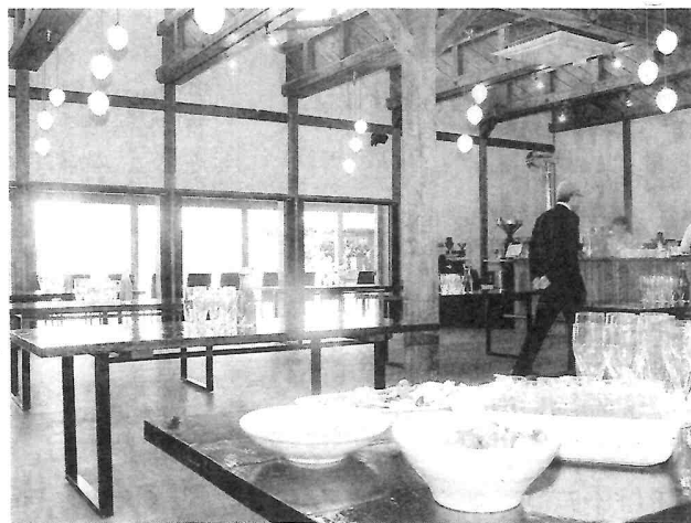
敷地内の蔵に入居したカフェ