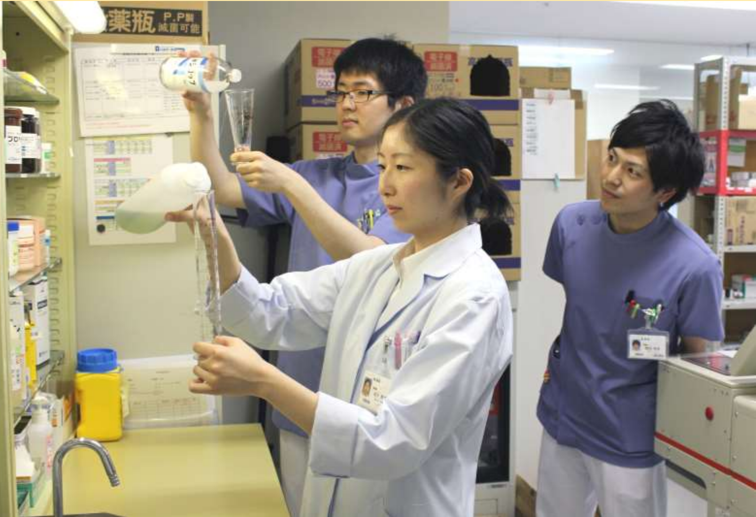
薬剤科 新人教育の様子