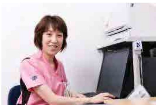
感染管理認定看護師

入院されている患者さんは、免疫力や体力の低下から感染への抵抗力も低下している危険があります。入院されている患者さんを守る為にも感染対策へのご協力をお願い致します。