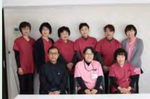
訪問看護ステーション たんぼぼ 訪問看護認定看護師

地域で暮らす利用者様の生き生きしたお顔がどんどん増えるよう、認定看護師としてステーションの職員と共に活動していきたいと思えます。