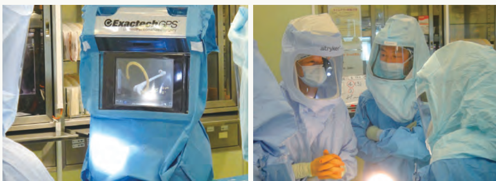
図1 コンピュータ・ナビゲーションを使用した手術の様子

当院では本格的に人工関節置換手術を2001年に導入し、本年7月に5000症例に到達しました。（グラフ）人工膝関節手術が3637例、人工股関節手術が1458例です。現在是一年間に400例以上の人工関節手術が行われています。男女別では男性が1118例（22%）、女性が3934例（78%）で女性の患者さんが多いことも特徴です。また、手術を受ける患者さんの平均年齢は膝関節76歳、股関節70歳と高齢者が多く、最近では90歳以上の患者さんも増加しています。