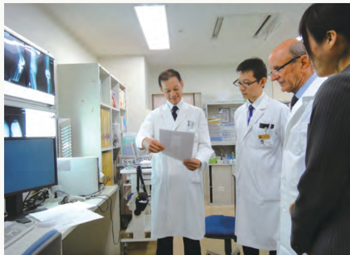
図2 手術見学の受け入れ